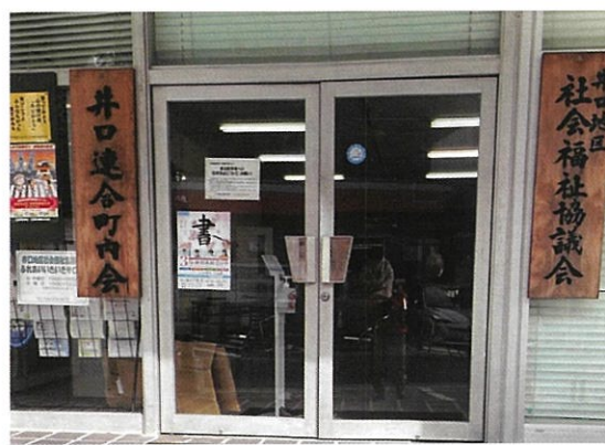
井口社会福祉協議会 玄関前