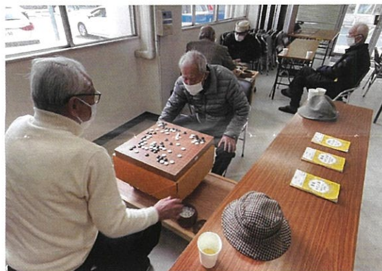
皆さん集まっての囲碁サロン

午後1時からドアが開き、井口集会所に地域の方が来られます。囲碁やハンドベルなどの地域交流サロンが開催されており、また井口地区社会福祉協議会の拠点、「よりどころ」でもあります。井口地区社会福祉協議会は昭和39年に発足、地域活動の要となるところです。どなたでも気軽にお立ち寄りいただける開かれた拠点を目指しています。